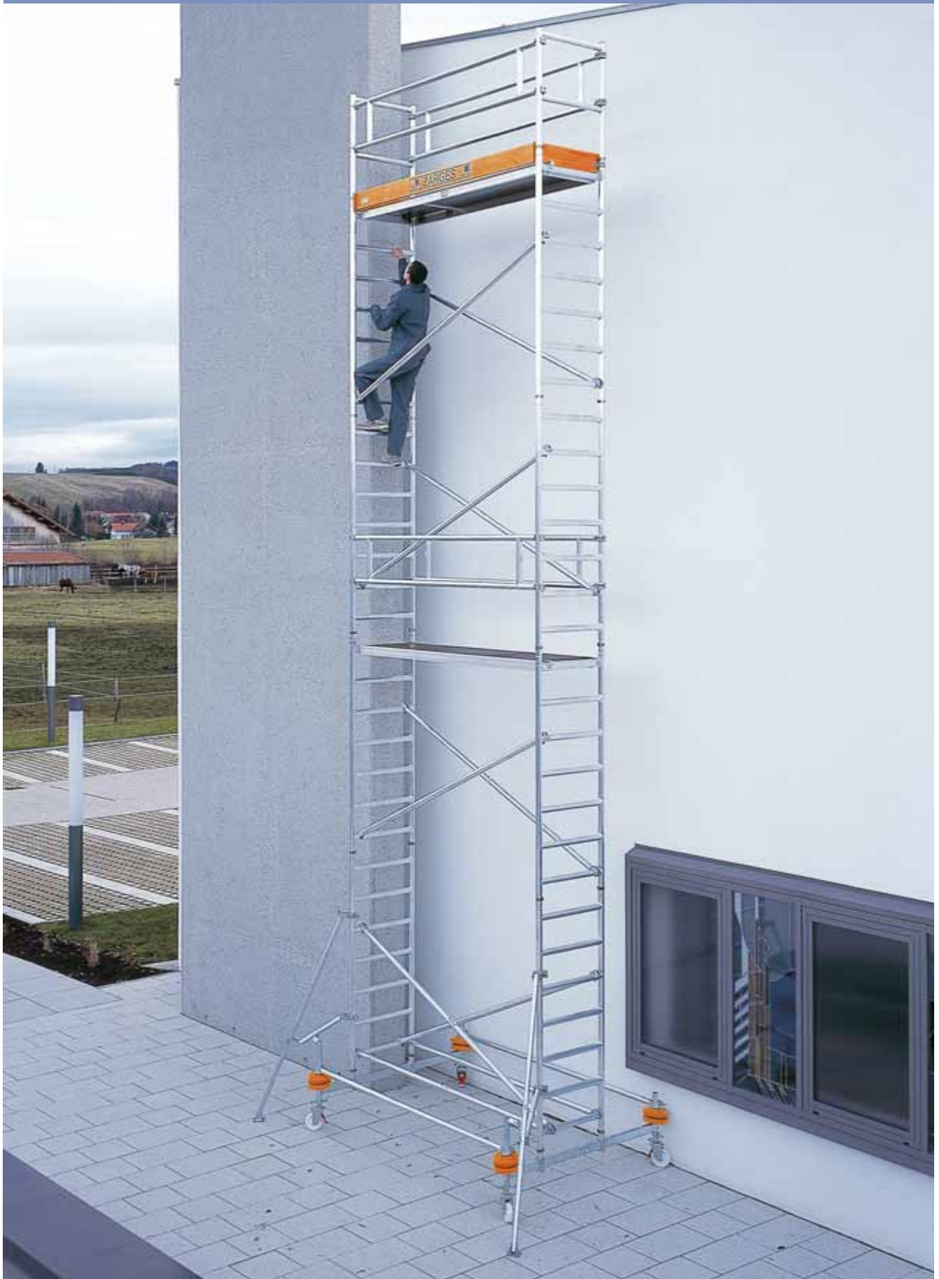
Z500 – Rullställning med stabilisatorer, 0,75 m x 2,50 m